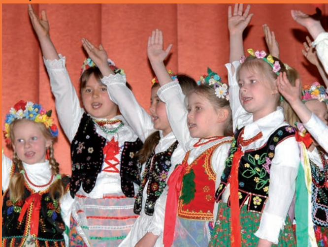
Zespół „Przedszkolaki Krakowiaki” z przedszkola w Krynicy-Zdroju.