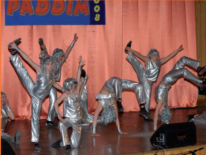
Formacja taneczna „Funkty Dolls” z Miejskiego Ośrodka Sportu i Rekreacji w Krynicy-Zdroju w tańcu „Kosmiczne Roboty”.