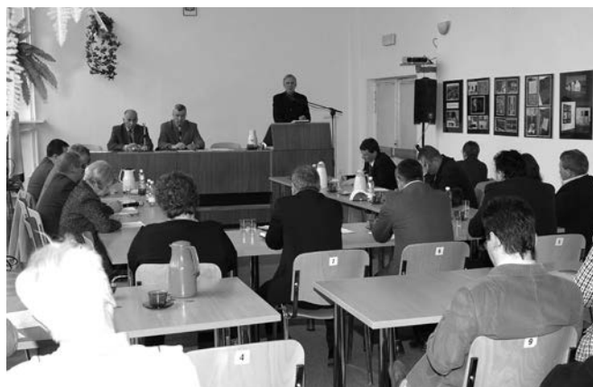
Fot. J. Kowalski

iło budżet gminy po stronie dochodów. Zrealizowano wszystkie planowane inwestycje, w tym: zakończono budowę Szkoły Podstawowej nr 2 oraz szereg inwestycji drogowych, oddano też do użytku dom polsko-słowacki zrealizowany ze środków unijnych INTERREG III A. Radni Rady Miejskiej w Krynicy-Zdroju uznali więc, że wszystkie wyznaczone na rok 2007 zadania budżetowe zostały zrealizowane i udzielili Burmistrzowi absolutorium podczas sesji absolutoryjnej 29 kwietnia 2008r.