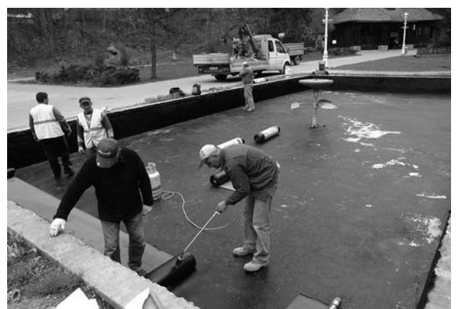
Przed sezonem letnim wykonano izolację wnętrza basenu fontanny przy Pijalni Jana-Józefa.