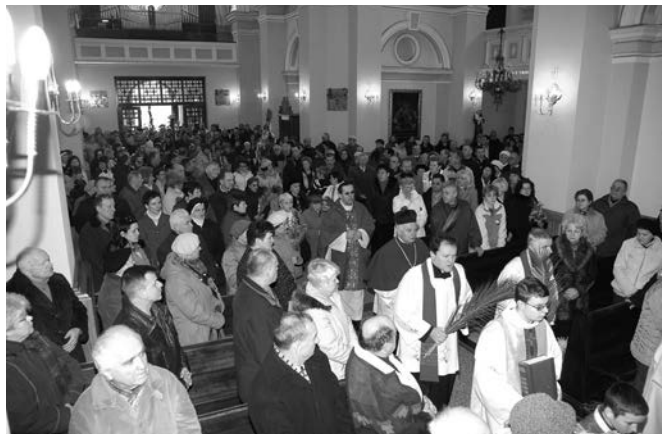
Niedziela palmowa 2008.

wielu kryniczan w poszukiwaniu pracy wyjeżdża za granicę czy w głąb Polski. Dane statystyczne za ubiegłe lata kształtują się następująco: chrzty: 2007 - 26; 2006 - 33; 2005 - 36; 2004 - 25, pogrzeby: 2007 - 36; 2006 - 31; 2005 - 35; 2004 - 29, śluby: 2007 - 24; 2006 - 28; 2005 - 27; 2004 - 25.