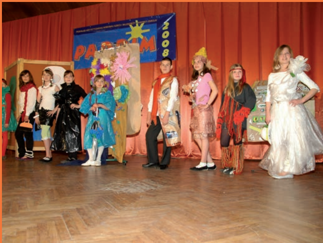
Pokaz mody ekologicznej „Nie wszystko na wysypisko” w wykonaniu klubu ekologicznego z SP nr 2 w Krynicy-Zdroju.