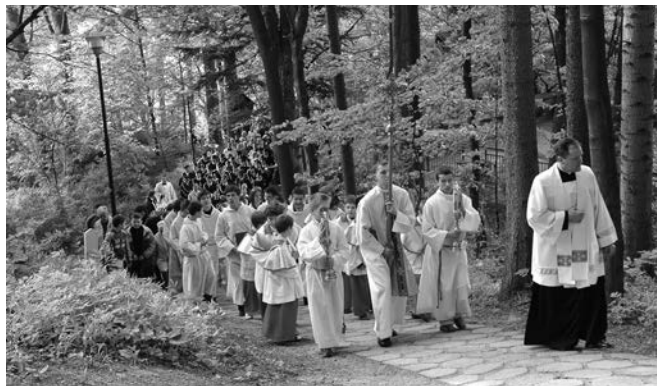
Procesja do figury Matki Bożej w parku.