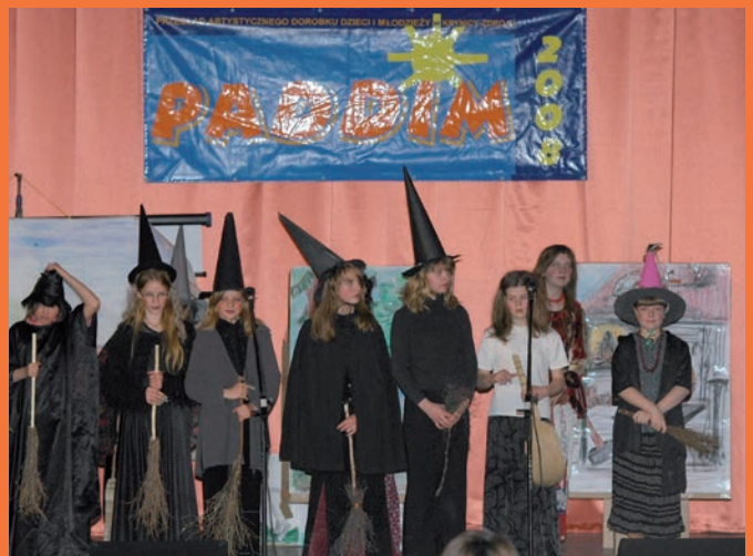
„Czarownice z Łysej Góry” w przedstawieniu kółka teatralnego SP w Bereście