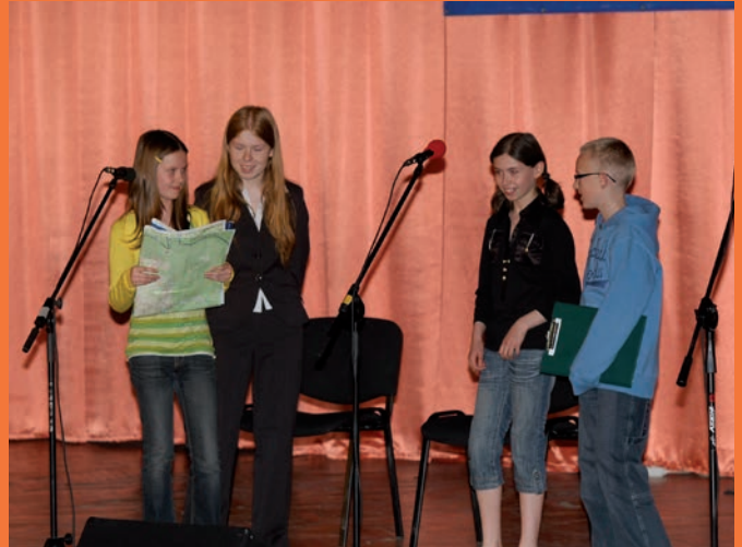
Kabaret w wykonaniu uczniów Gimnazjum w Krynicy-Zdroju.