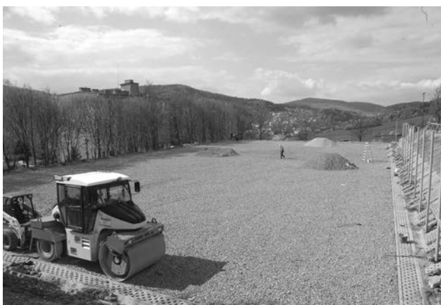
Na samym szczycie ul. Źródlanej trwa budowa nowego boiska piłkarskiego.