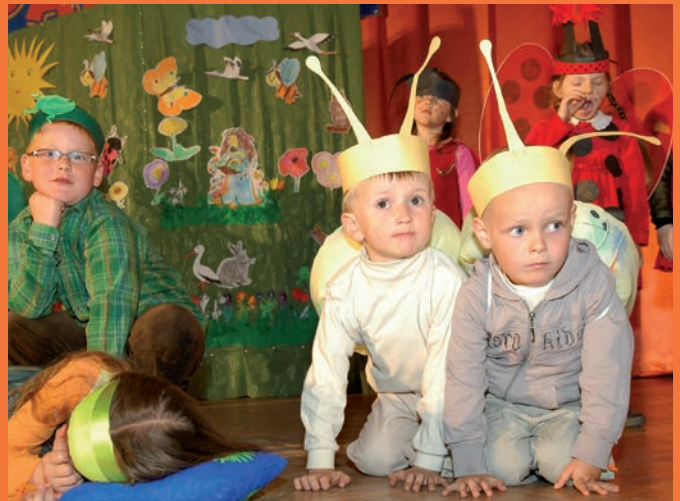
Przedszkolaki „Na łące” z Niepublicznego Przedszkola w Czyrnej.