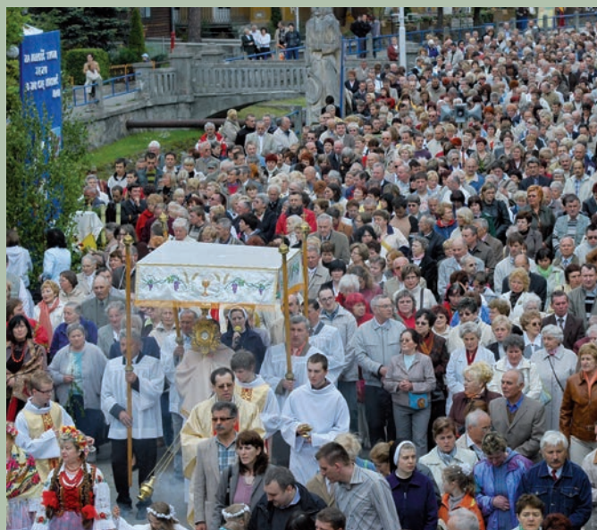
Tegoroczna Procesja Bożego Ciała.