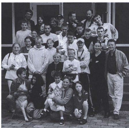
Pamiętkowe zdjęcie z Marburga

bez którego nie ma mowy o efektach. Mieliśmy szczęście, bo poprzedniej zimy dwukrotnie przyjechała do szkoły w Piorunce jedna z najlepszych formacji w Polsce, grupa „Ready to battle” z Bydgoszczy. Okazało się, że trening z najlepszymi czyni cuda. B–boye z Bydgoszczy wyjechała, ale atmosfera pozostała. Postępy przyszły bardzo szybko.