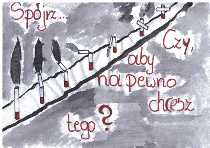
Dorota Grecka, SP Nr 2

Nagrody dla zwycięzców i wyróżnionych ufundowali: