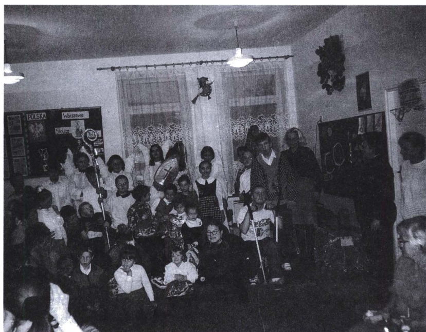
Pamiątkowe zdjęcie ze Świętym Mikołajem i aniołkami

9 grudnia ubiegłego roku do budynku przedszkola przy ulicy Świdzińskiego zaproszono dzieci specjalnej troski na mikołajkowe spotkanie. Rozpoczęło się słodkim poczęstunkiem i występem Grupy Artystycznej ze Szkoły Podstawowej Nr 3, która zaprezentowała niezwykle interesujący repertuar – wiersze, piosenki a także występy baletowe. W oczekiwaniu na Św. Mikołaja trwały wspólne zabawy i tańce. Przybycie Świętego Mikołaja z koszem pełnym prezentów powitano okrzykami radości. Dla każdego dziecka znalazła się paczuska i miłe słowo.