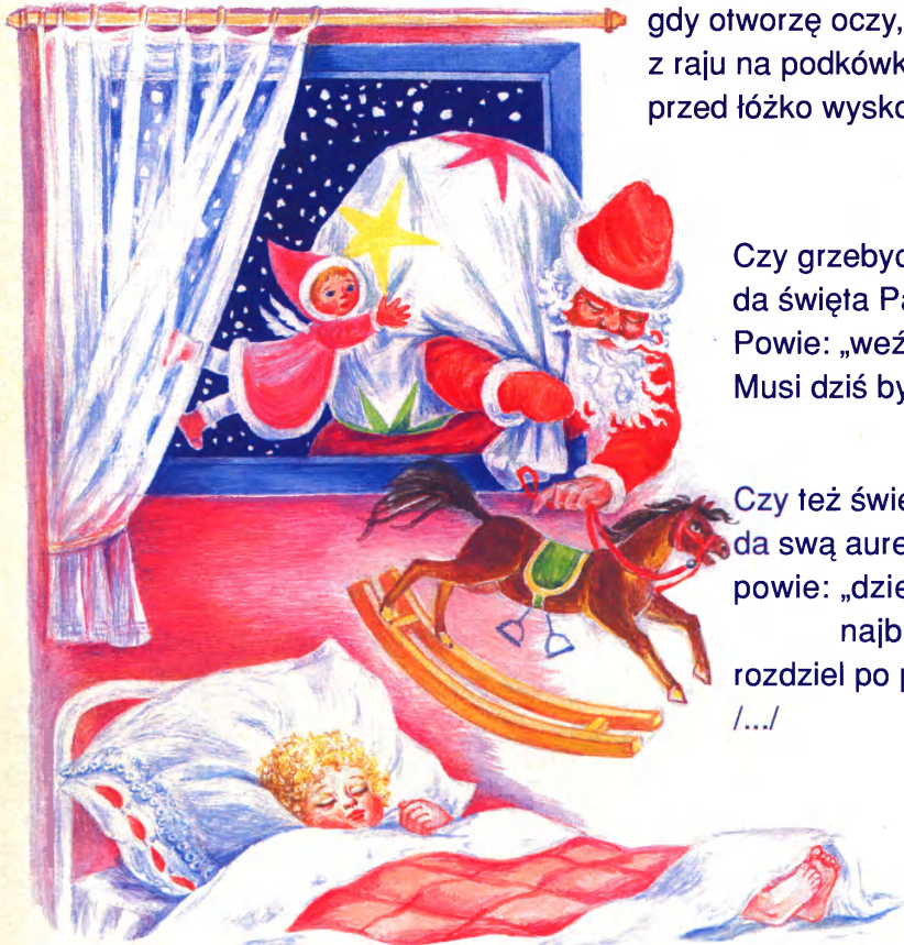
Ilustracja Stanisława Lechicka

Czy też święty Józef da swą aureolę, powie: „dzieciom najbiedniejszym rozdziel po połowie”. /.../