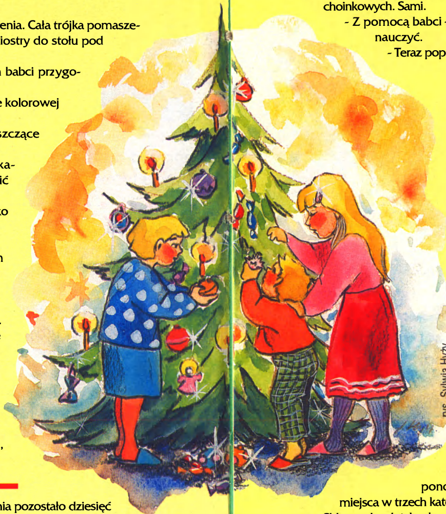
rys. Sylwia Hryży

Minęły dwa tygodnie. Do Świąt Bożego Narodzenia pozostało dziesięć dni. Dzieci spędzały w pokoju babci całe wieczory. Z takim zapalem uczyły się robić różne choinkowe cacka, że trudno je było zapędzić do snu. Gdyby nie wczesne wstawanie – na roraty – zajęcia w pokoju babci przeciągałyby się jeszcze dłużej.