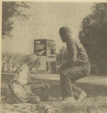
W Myśliczu nad Popradem trwają Konfrontacje Ruchu Artystycznego Młodzieży.